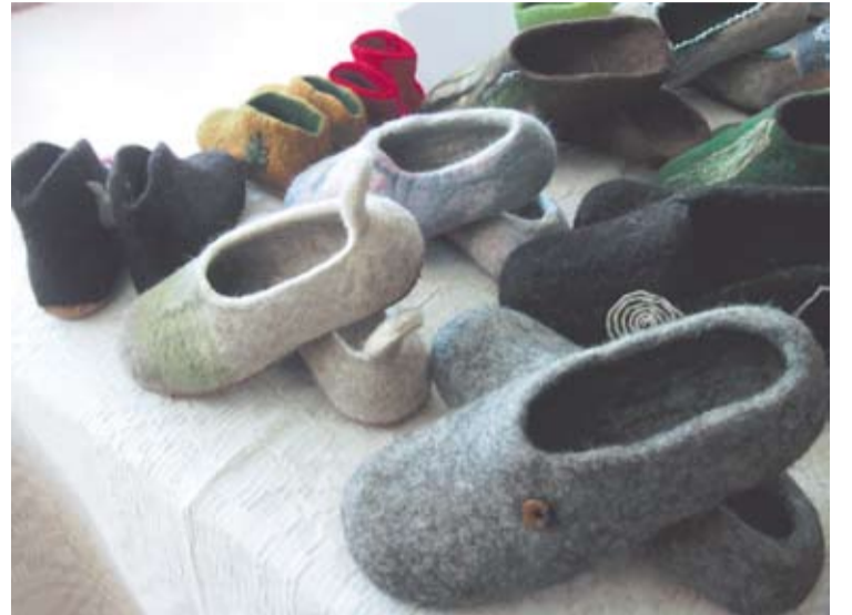
Elegantiški ir spalvingi.