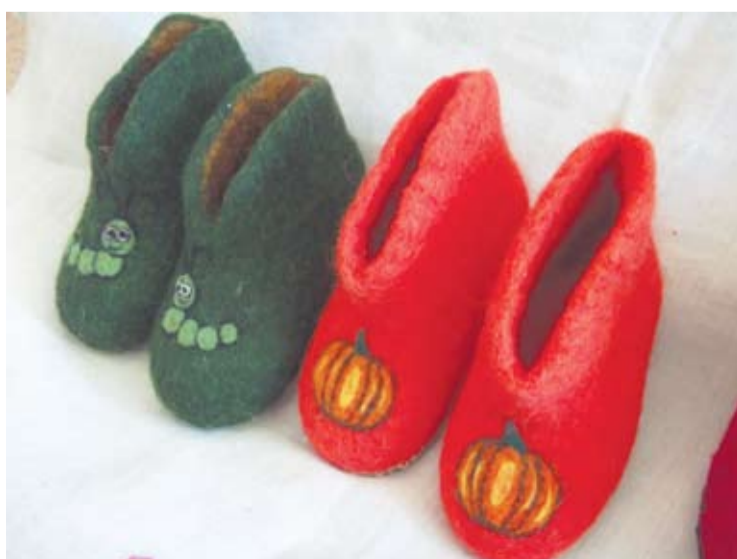
Vaikučių džiaugsmui...

Ir man į tas grožybes žvelgiant poetinės pajautos sukyla. Linksma spalvų paletė, darbeliai praktiškai juodi, pilki, rudi, tamsiai žali ar žaismingi rožiniai, raudoni, melsvi, daugelis nuveltai kelias tonais, tikriausiu margumynu. Įvairios ir formos – veik ūkiški klasikinių formų veltinukai su aulu ir kaip karalaičių kurpaitės – elegantiškos storo veltinio tapukės su grakščiais ūsais pakulnėse, kad patogiau būtų apsiauti bei nuslauti. Mažyčiai veltinukai vaikams, veikiau klasikinės šlepetės. Solidžiai rimti ir įvairiais paveikslėliais, dekoru palinksinti tapukai: vieniems ant