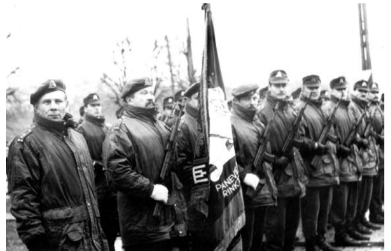
Kadrai iš Vyčio apygardos 5-osios rinktinės istorijos.

vystymui. Tegul mūsų šūkis - „Mūsų galia – meilė Tėvynei“ - įkvepia mus ateities tarnybai Vyčio rinktinės, Lietuvos Kariuomenės ir Tėvynės Lietuvos bei jos žmonių labui.