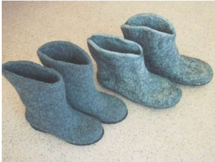
Šilti ir patogūs klasikiniai veltinukai.